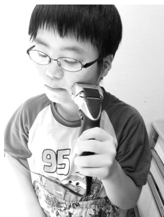
写真は最近自ら始めた髭剃り(笑)

現在もう1つ取り組んでいることは「自力単独通学」です。下校のみ、バスを降りてから家まで1人で帰る練習をしています。ラッキーなことにマンション降りてすぐのスクールバス停・・・1週間の試行期間を先生と家族が見守り、その後学校で会議にかけられて許可が下りたら自力通学OKになります。近いとは言え、不測の事態が起こったときに1人で対処できるかなど様々なことが考慮されます。私の「1人だからね!」のプレッシャーからか毎度緊張の面持ちです。