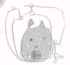
イラスト / 柏市立第二小学校 特別支援学級のおともだち

1994年発足。人とのつながりの中で子どもたちが思いが豊かに育ってほしいと願って活動しています。2011年度には「子ども読書活動優秀実践団体」として文部科学大臣より表彰を受けました。